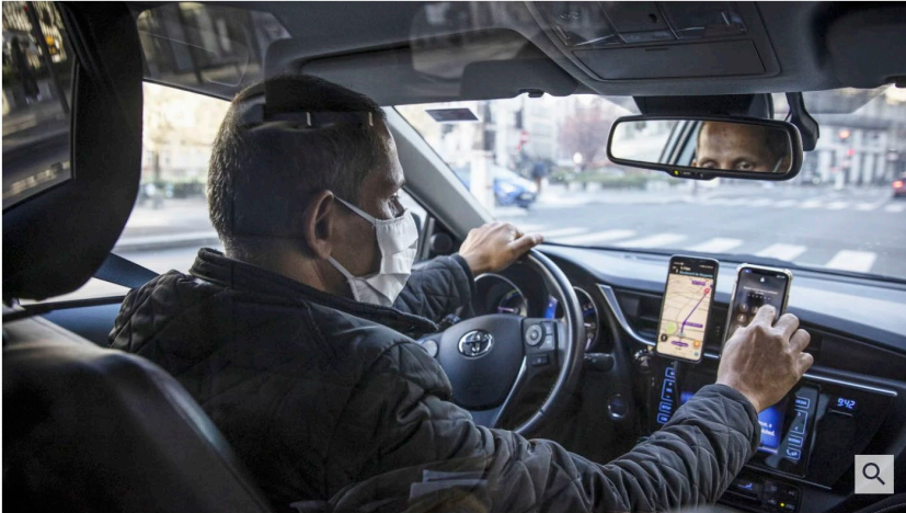
Prekär beschäftigt: ein Uber-Fahrer in Paris.

9. Dezember 2021, 12:54 Uhr | Lesezeit: 2 min