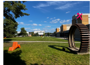
x markiert Standort i.d. Uni